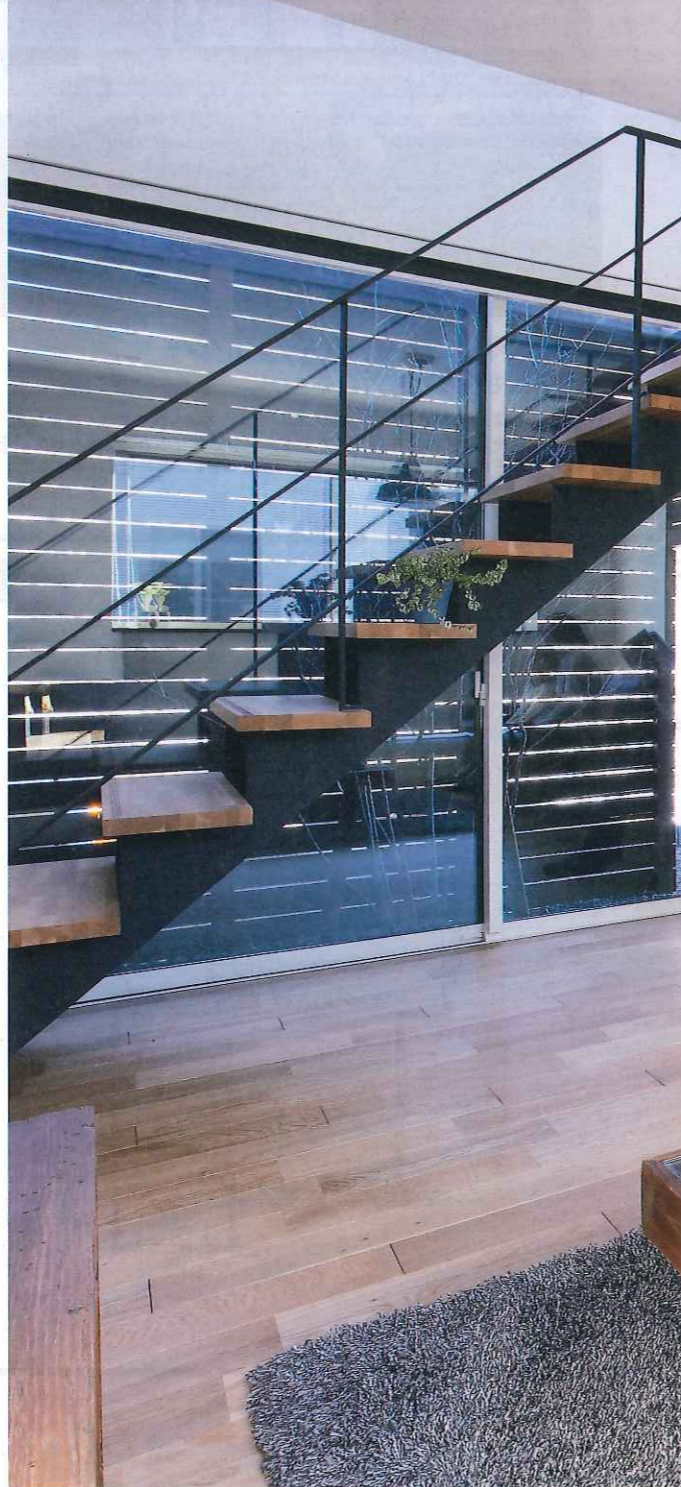
パティオに面した大きな掃き出し窓がリビングでくつろぐ時間をより明るく豊かに演出する