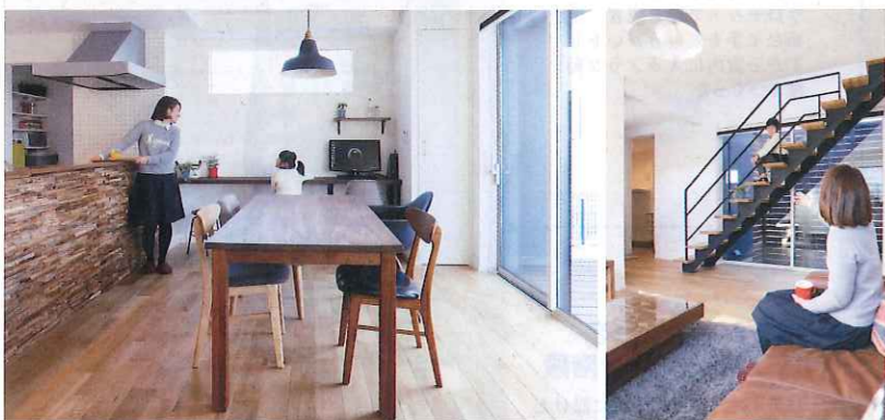
右/ワイドな窓を斜めに横切るスタイリッシュなスケルトン階段。日当たりが良いので、よくここに座ってママとおしゃべり 左/キッチンの前壁のウッドウォール、スペイン漆喰の壁、ナラのむく材の床など、年月とともに味が出る自然素材をふんだんに使用