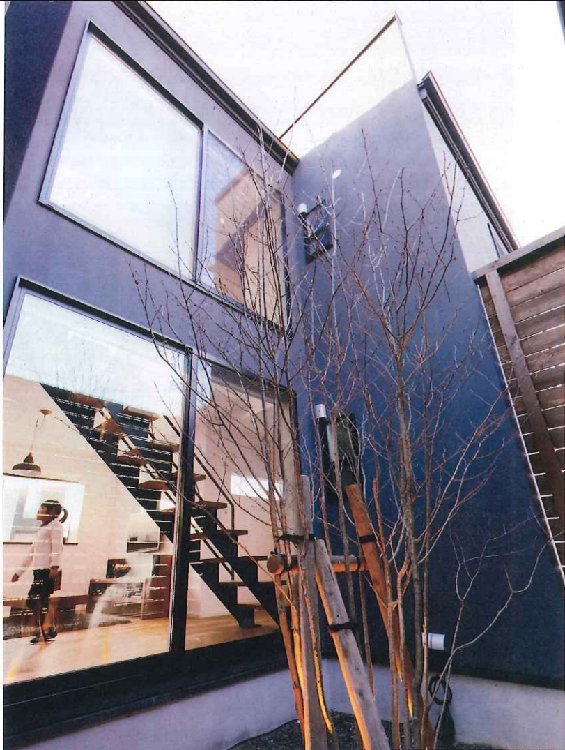
プライバシーを守りながら光と風、自然を取りこむパティオ。夫妻の希望でシンボルツリーには葉の形が美しい高木のアオハダを植栽。落葉するので冬は裸木だが、夜は下からライトアップした木を眺めてリラックス。季節の変化も感じられ、子どもとの会話も弾む