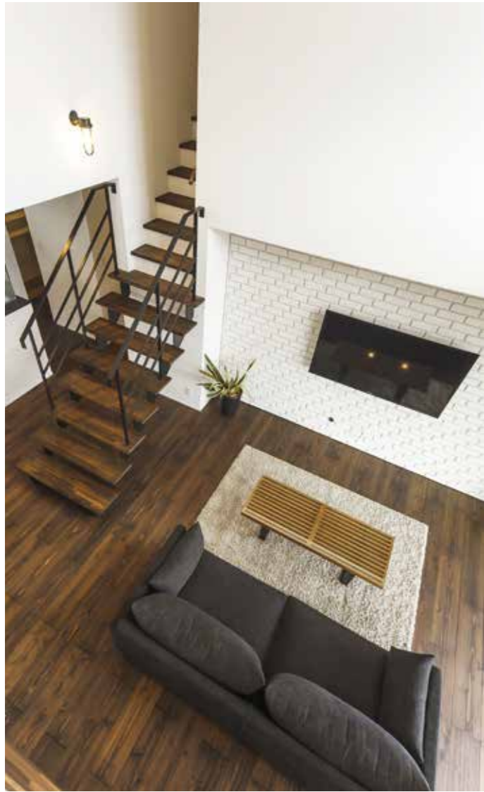
白壁と自然塗料でアンティークな雰囲気に仕上げた無垢床のコントラストが上質な空間を演出。壁掛けテレビの背面はレンガ調タイルにし、お洒落感アップ（写真は全て施工例）