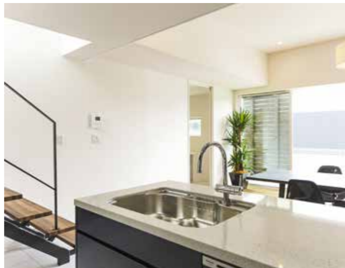
ネイビー、ホワイト、グレーでコーディネートしたスタイリッシュなキッチン。カーブを描く水栓のフォルムも美しい。スケルトン階段が空間のオブジェのよう

自然素材、オーダー家具…。暮らしを作るワクワク感を一緒に あなたは「家を買いたい？」「それとも」家づくりがしたい？。「住みたい家をオシャレに、住みやすく、しかもコストダウンを図りながら叶えられるとしたら…」「好きなものを選びながら、家を作るプロセスも楽しめるとしたら…」。スタップならその全てを満たしながら、あなただけの「オンリーワンの家づくり」を提案してくれる。 同社はデザインが得意な「設計事務所」と工事のプロフェッショナル「工務店」のいいとこ取りを実現した「設計のできる工務店」。下請け業者を使わずに自社施工・管理をベースとしているのでコストダウンが可能。だからこそ「自然素材やオーダー家具など、あれもこれもとことんこだわりたい」ながら、予算を最大限に活かしたコストパフォーマンスの高い家づくりが実現できた」とOB客からも好評。暮らしに必要なリアルな情報を手に入れられる新築完成内覧会や、実際の住心地などを聞くことができるOB邸へ案内してくれるので、気軽に問い合わせで参加しよう！