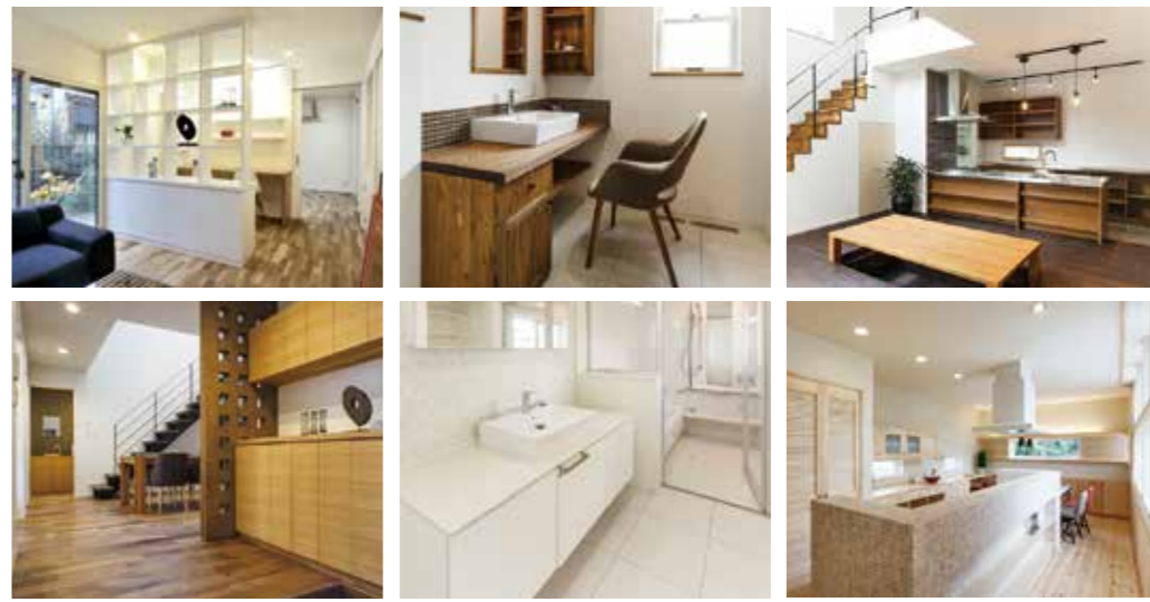
家具や建具もオーダーメイドにすれば、新しい暮らしへのワクワク感もさらにアップ。同社では初回プランの段階で、オーダー家具の予算も配分し、トータルで家づくりを提案。OB客の実例を参考にしながら、あなたならどんなデザインにしたいかイメージを膨らませてみて

●会社概要 (設立) 1997年9月 (創業1992年6月) (資本金) 1000万円 (従業員数) 29名 (2015年8月現在) (FAX) 022-271-0841 (URL) http://www.stap.co.jp/ (対応可能工法) 木造軸組工法、2×4工法 (施工実績) 17棟 (2015年度) (建設業許可番号) 宮城県知事許可 (般-27) 第17436号 (一級建築士事務所登録) 宮城県知事登録第12410004号 (関連会社) ダイク (株) (得意分野) デザイン力、自然素材、オーダーキッチン・オーダー家具 (事業内容) 新築・増改築リフォームの企画・施工・アフター管理