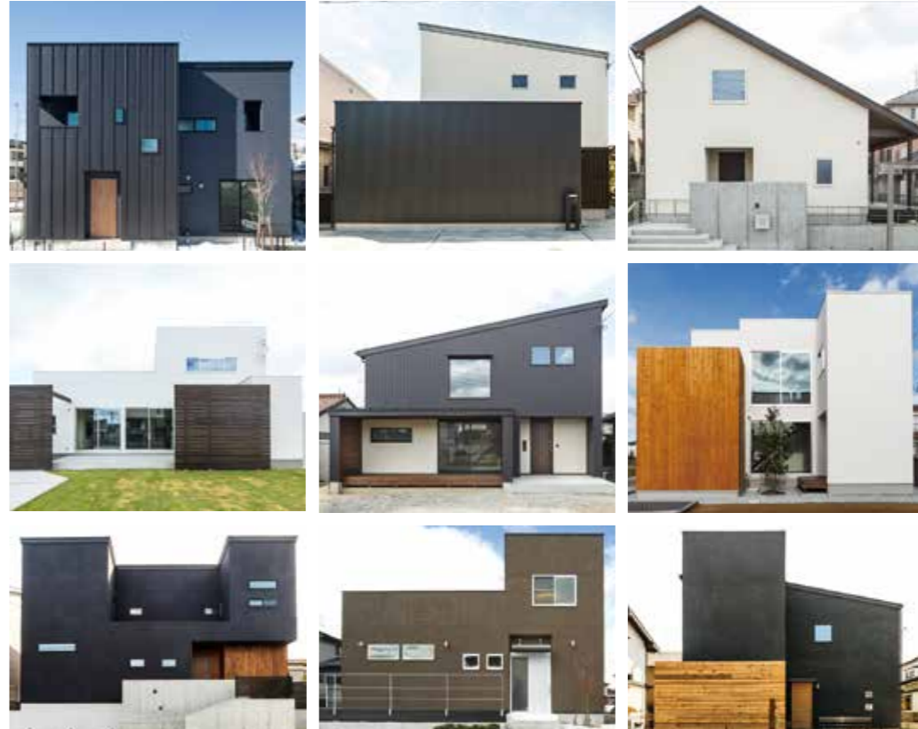
【スタッフのこだわり/表情豊かな塗り壁の外壁】住む家族の顔となり、住まいの印象を左右する外観。同社では職人の手仕事で美しい塗り壁を中心に施工。表面の仕上げ方でさまざまな表情をつくり出せるのは塗り壁ならではの、オンリーワンの趣ある表情に仕上げよう (全て施工例)

多くの人が不安に思う「資金面」のこと、土地の購入から家づくりを考えている人に向けた「土地の選び方のポイント」など、家づくりをはじめる前に知っておいてほしいことを伝える各種セミナーも開催中！楽しく学びながら、本格的な家づくりに備えよう！