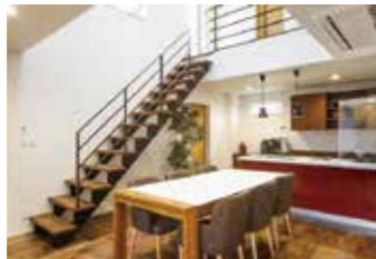
赤いオーダーキッチン中心に広がるコミュニケーション空間。美しく、そして機能的