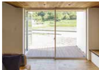
天井のウッドパネルがデッキと連続し、内と外がゆるやかにつながる開放的な空間を創出