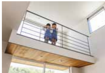
リビング上部は大きな吹抜け空間。畳敷きのブリッジから子ども達がピースサイン！