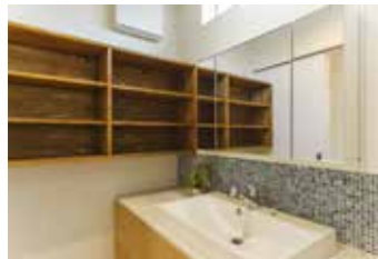
モザイクタイルや大きな一枚鏡、間接照明でモダンなオーダーメイドの洗面化粧台