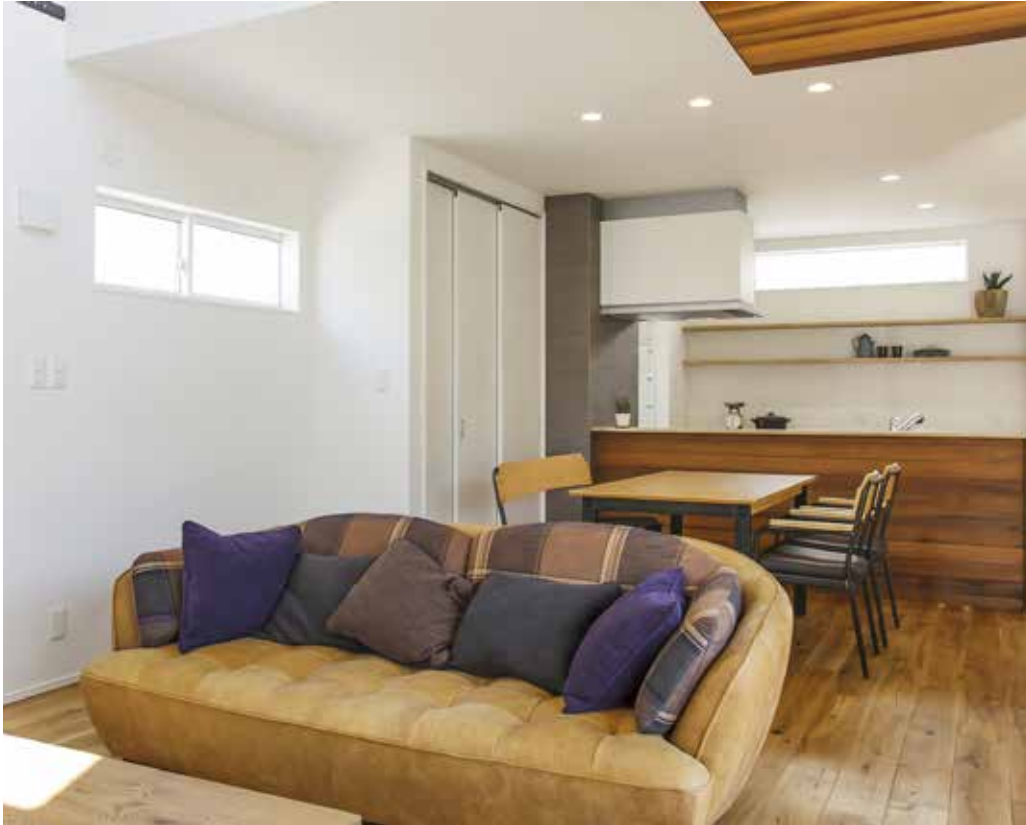
リビングで遊ぶ子ども達の様子を見守りながら家事ができるオープンキッチンはママのお気に入り。オーク材のフローリングやレッドシダーの天井（一部）、壁にスペイン漆喰を使用したぬくもりあふれる住まいが完成。住む程に味わいを深め、家族の思い出が刻まれていく