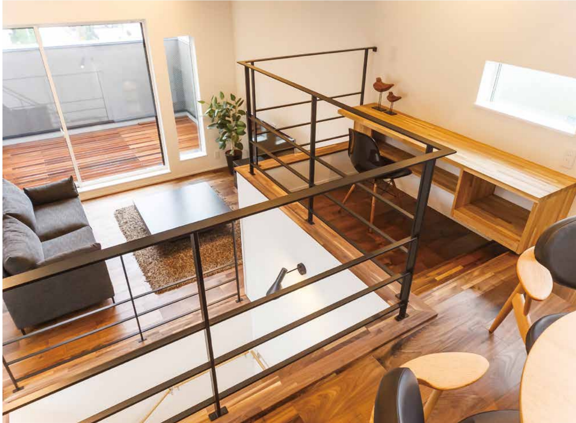
2階リビングからスキップフロアでダイニング〜キッチンへとつながる多層の家。ダイニングから2段下がったフロアにはカウンターを設けたフリースペースを設置。決して広くない土地も、縦の空間を有効利用することで、天井が高い開放的な空間づくりを実現