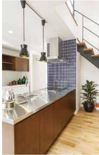
タイル、ステンレス、木材…、異素材をミックスしたカフェライクなオーダーキッチン