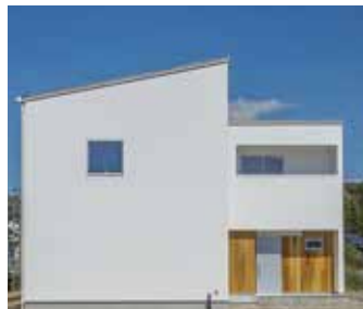
真っ白な外観と片流れ屋根が目目を惹く外観。玄関周りの無垢材がぬくもり感をプラス