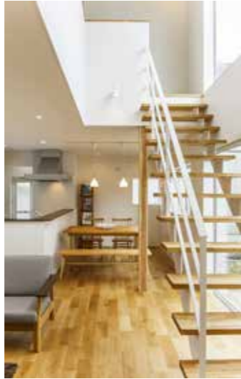
踏み板に木を組合せた鉄骨のスケルトン階段。空間に開放感をもたらし、家具のように美しい