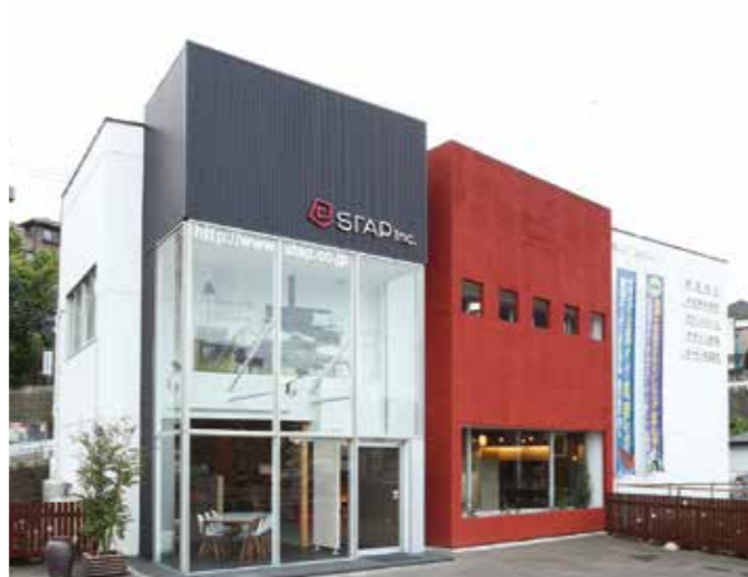
「STAP SHOP」は仙台泉線沿い、泉中央方面に向かって左手。暮らし方がイメージできるライフシーンやオーダー家具、自然素材に触れながら、自分が住みたい家が見つかるはず！