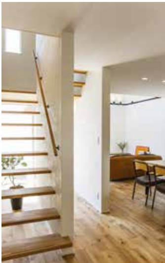
外の明るい光を玄関まで導くスケルトン階段。LDとゆるやかにつながる位置に設計