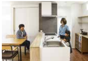
グレーのタイルやテラコッタ風のフロアなど素材使いにこだわったオープンキッチン