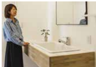
白いタイルと木の台座に大きなボウルを埋め込んだ、オーダーメイドの洗面化粧台