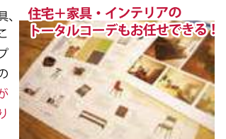
外部のショップやクリエイターともコラボし、高いレベルで暮らしを提案 (概念図)

家づくりは土地、デザイン、間取り、家具、ライフスタイルという順番で進めていくことが多いかもしれない。しかし、スタッフの家づくりはその逆だ。家は一生に一度の特別なもの。だからこそ 土地やデザインが先にくるのではなく「ライフスタイルありき」 。これがスタッフの考え方だ。