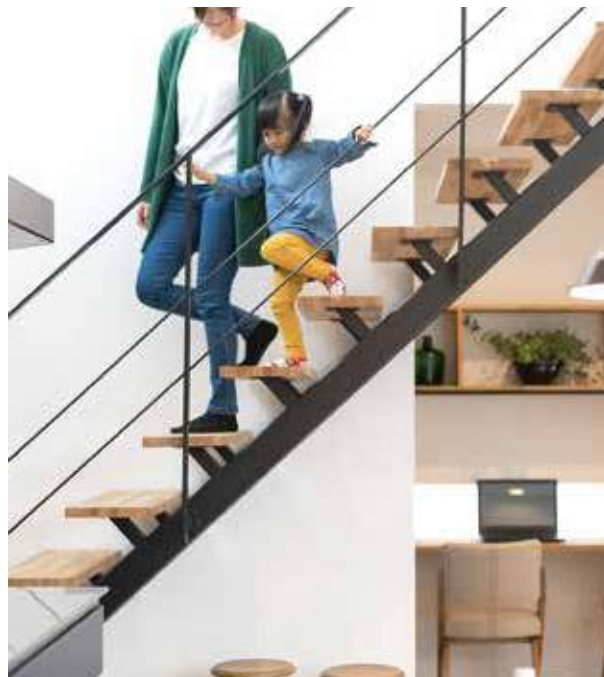
お洒落なスケルトン階段。上ったり、下りたりも楽しい時間（写真は全て施工例）