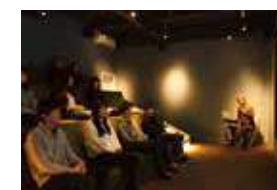
迫力ある映像を楽しむシアタールーム

住宅設計+家具のショールーム「STAP SHOP」が注目を集めている。バーカウンターや巨大スクリーンなど、ショールームを超越する仕掛けが満載。