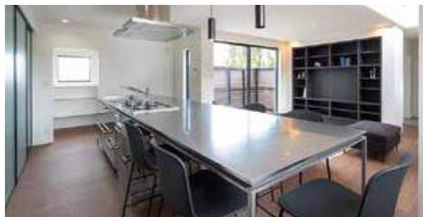
一枚板のようなステンレス、浮遊感のあるデザインが美しいこだわりのキッチン