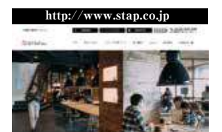
詳細はホームページでチェックしよう

あなたの理想の暮らしを踏まえて、設計士が「今完結する間取り」ではなく「先々まで見据えた間取り」を練り、好みに合わせたデザインの家を作り上げてくれる。