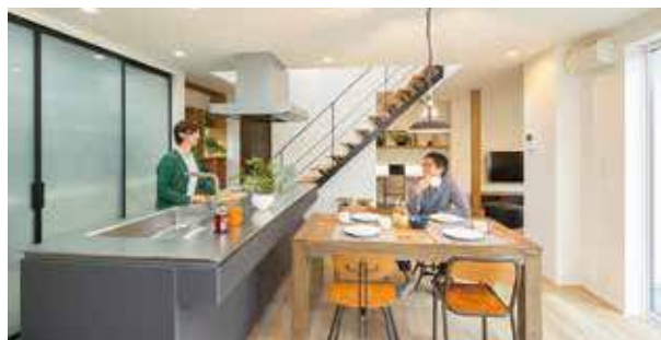
リビングと緩やかに繋がるダイニング。家族の絆を育むアイランドキッチンを採用