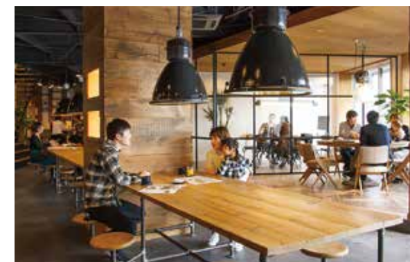
お洒落な空間で「どんな暮らしをしたいのか?」、夢を語ろう (2点共ショールーム)